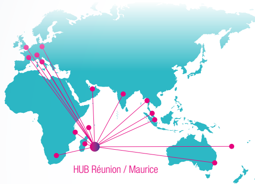
HUB Réunion / Maurice